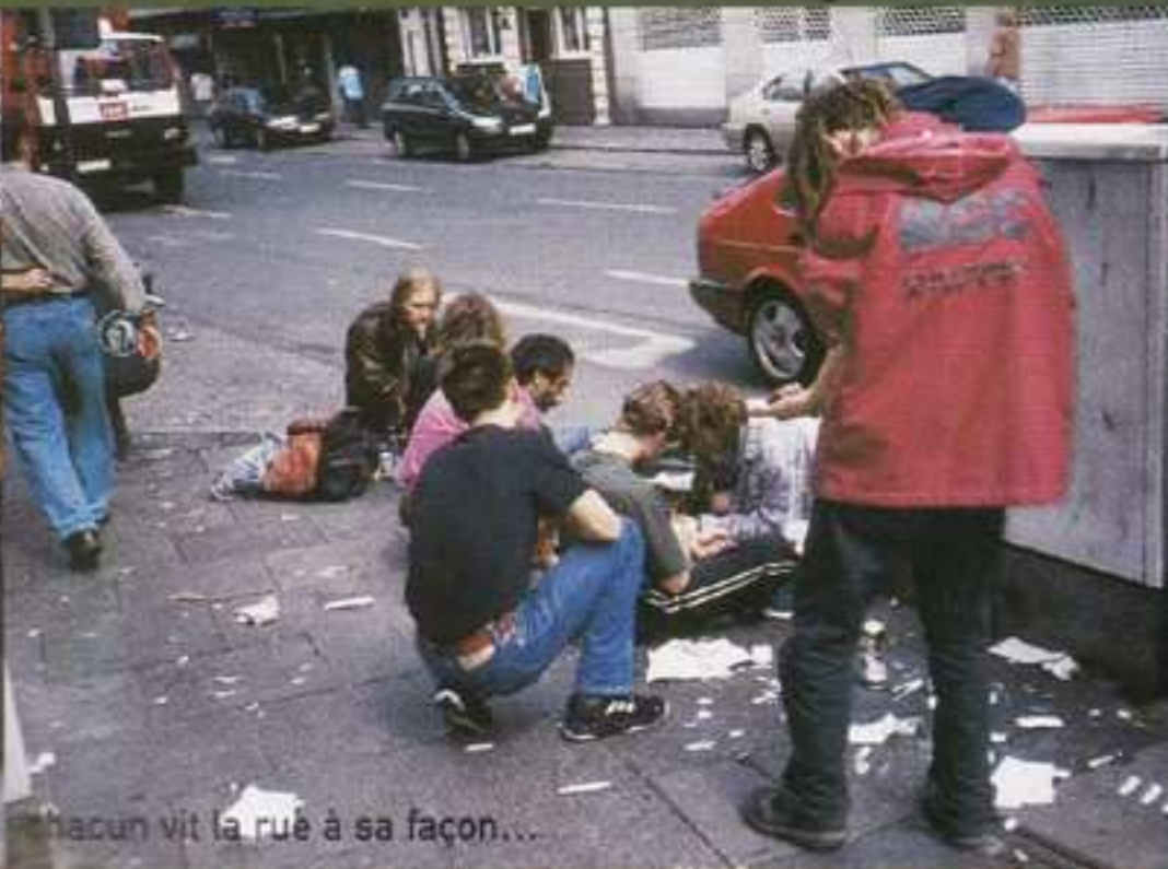
chacun vit la rue à sa façon...