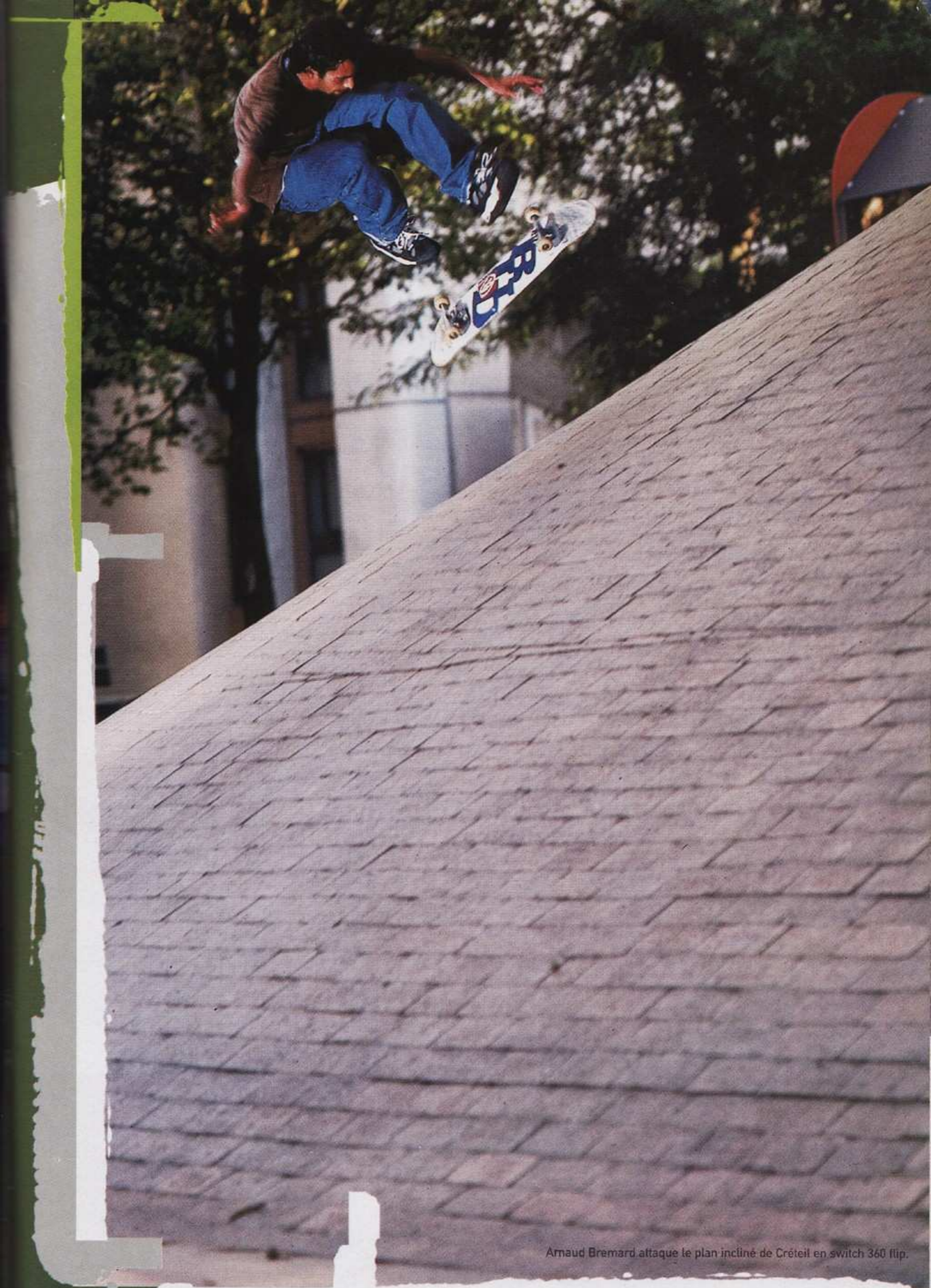
Arnaud Bremard attaque le plan incliné de Créteil en switch 360 flip.